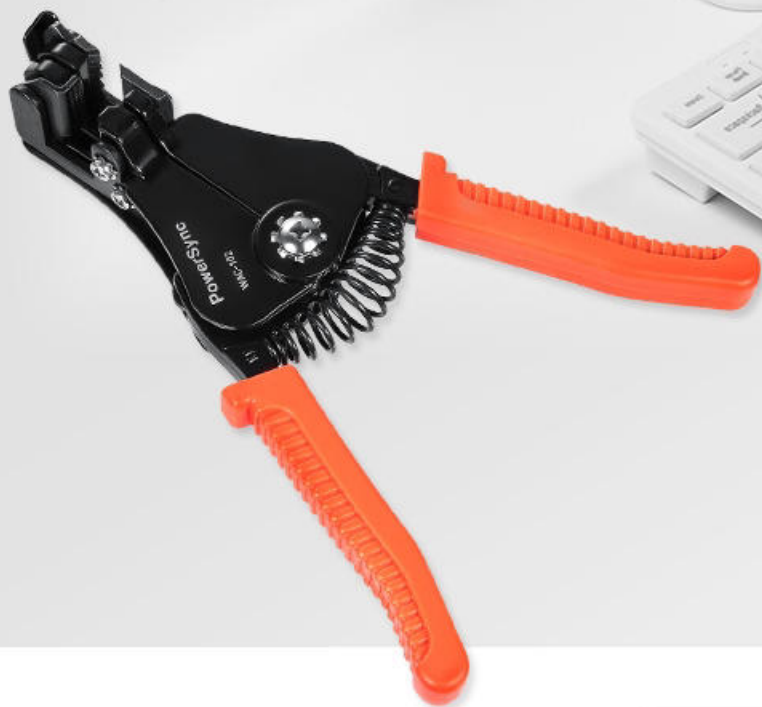
自動剝線鉗 Automatic wire stripper